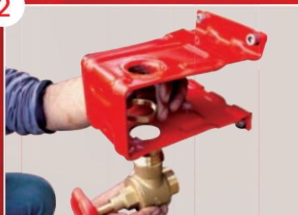
Positionnement du robinet d'arrêt