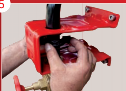
Maintien en position de l'ensemble bobine et tube d'alimentation par un seul collier