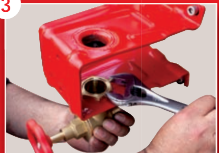
Fixation du robinet d'arrêt