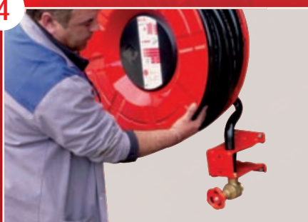
Mise en place du dévidoir par une seule personne