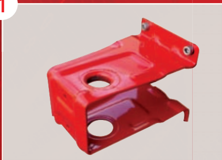
Fixation du support mural indépendamment du RIA