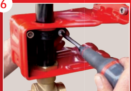
Assemblage du collier par deux vis